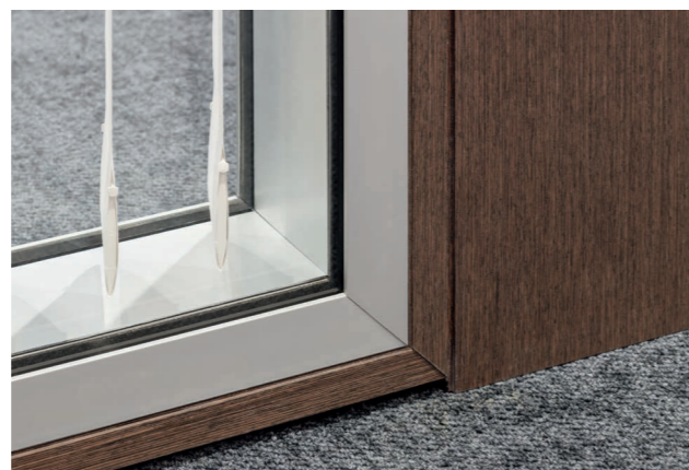
Conserver une vue maximale tout en étant protégé du bruit !

Wider SA, membre de la FeuerschutzTeam à Busigny, a équipé le siège social de Nestlé à Vevey de portes pivotantes EI30 et de cloisons vitrées insonorisantes à hauteur de pièce répondant à EI30.