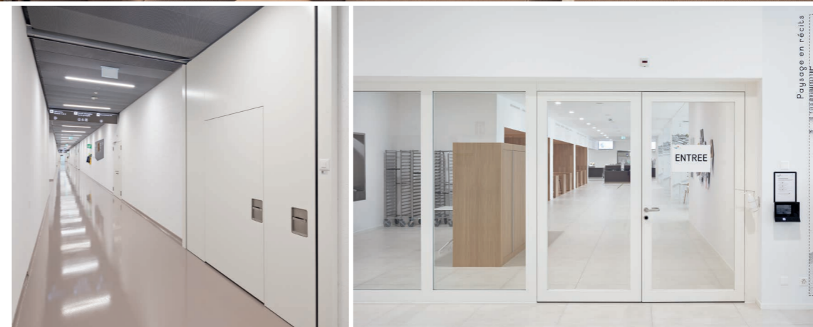
Porte coupe-feu avec fonctions issue de secours