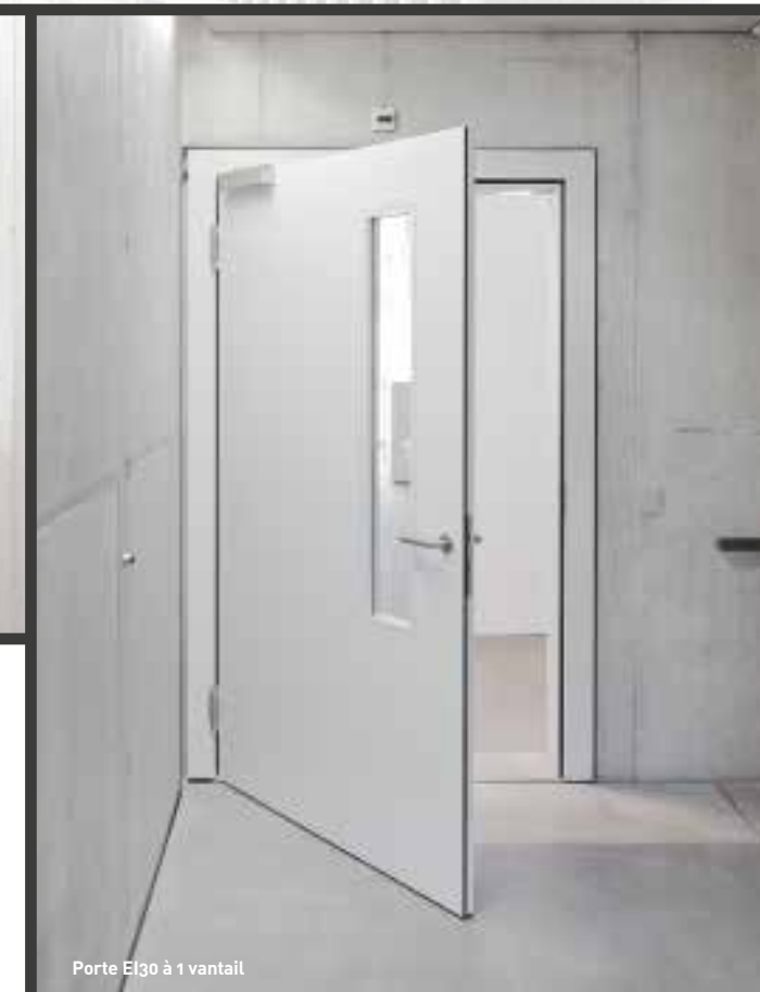
Porte EI30 à 1 vantail

Pour cet important projet, Knuchel AG, partenaire de la FeuerschutzTeam à Coire, s'est vu attribuer la commande de l'ensemble des portes intérieures, des vitrages et des portes coulissantes. La diversité des éléments de portes, 75 au total, allait des simples portes EI30 à 1 ou 2 vantaux et des portes pivotantes, jusqu'aux vitrages répondant aux exigences EI30 et EI60.