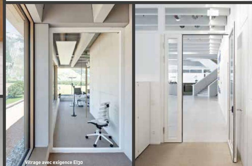
Vitrage avec exigence EI30