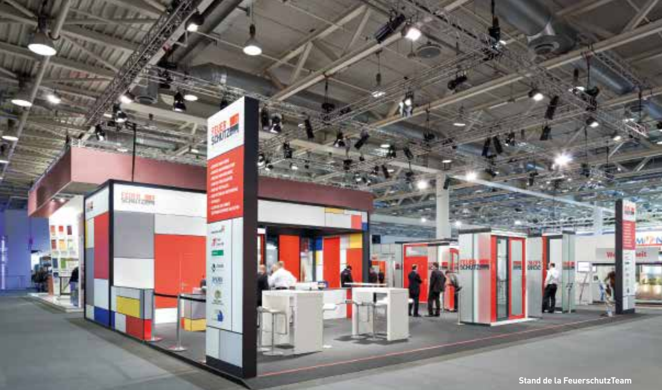
Stand de la FeuerschutzTeam