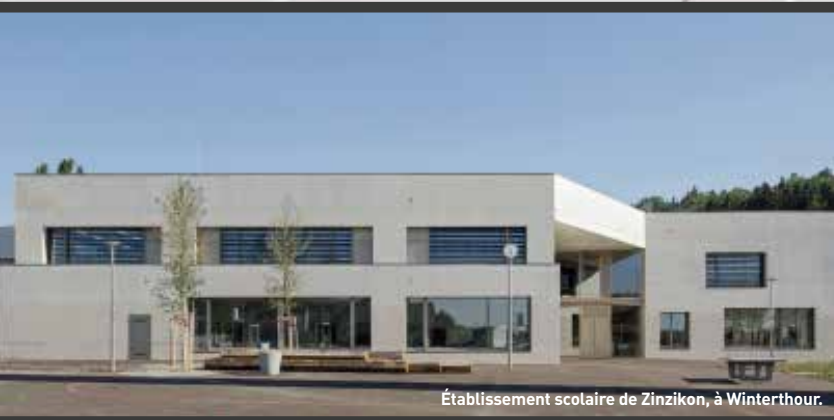
Établissement scolaire de Zinzikon, à Winterthour.

C'est avec ce projet parfaitement bien pensé que le cabinet Adrian Streich Architekten AG a comblé toutes les attentes, et ce à plusieurs égards. En tant qu'établissement scolaire à Oberwinterthour, le bâtiment couvre les besoins croissants des constructions résidentielles des environs, tandis que le déroulement du chantier et le respect des coûts sont jugés « exemplaires » par les responsables. Avec ses quatre accès, l'école s'ouvre sur tous les côtés et remplit par là même sa fonction de centre de quartier – le gymnase et la salle de chant, par exemple, peuvent ainsi être utilisés par les habitants et pour des événements. Finalement, l'établissement scolaire de Zinzikon a aussi été récompensé à l'ARC Award 2015. Pour ce projet de référence, Gentsch AG et von Büren + Sommer AG, partenaires de la FeuerschutzTeam, ont fourni tous les systèmes complexes de portes, dont des portes coulissantes en version vitrée.