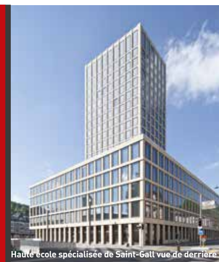
Haute école spécialisée de Saint-Gall vue de derrière

« Les spécifications en matières d'efficience énergétique, d'insonorisation et de domotique étaient elles aussi très contraignantes. Pour les portes, il nous a donc fallu faire appel à une entreprise qui, grâce à son savoir-faire, puisse nous épauler à chaque phase de la planification. Lehman Arnegg AG nous a donné entière satisfaction tout au long du projet, et nous espérons renouveler cette collaboration. »