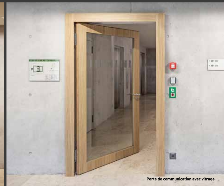
Porte de communication avec vitrage