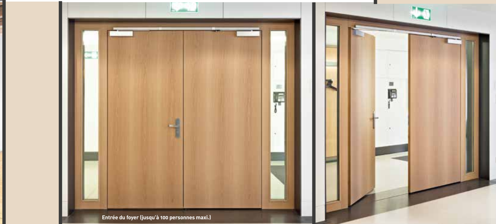
Entrée du foyer (jusqu'à 100 personnes maxi.)