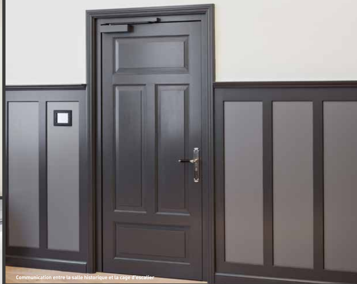
Communication entre la salle historique et la cage d'escalier