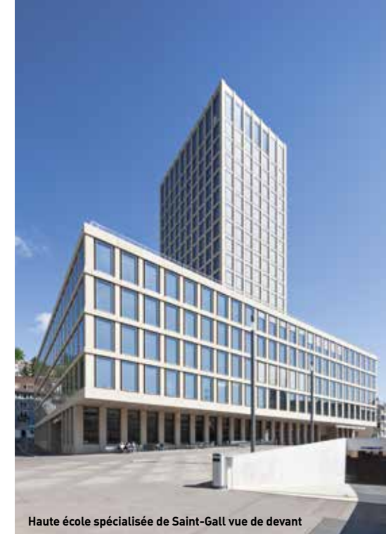
Haute école spécialisée de Saint-Gall vue de devant

C'est dans ce contexte que Lehmann Arnegg AG, partenaire de la FeuerschutzTeam, a pu se qualifier pour la gestion intégrale des portes. Il s'agissait, d'une part, de présenter un concept complet répondant à une qualité architecturale élevée, et, d'autre part, de satisfaire aux contraintes importantes en matière d'isolation acoustique et de protection incendie dans un programme de locaux à la fois compact et complexe. En réponse à ces exigences, les portes mises en œuvre ont été réalisées pour la plupart avec 1 ou 2 vantaux, certaines avec un vitrage et un élargissement du cadre. Dans les espaces publics, les surfaces sont en chêne verni naturel, et dans les secteurs techniques, elles sont recouvertes d'une peinture couvrante appliquée au pistolet.