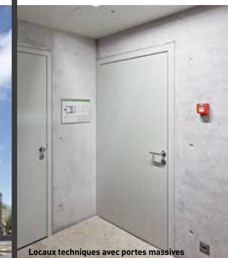
Locaux techniques avec portes massives