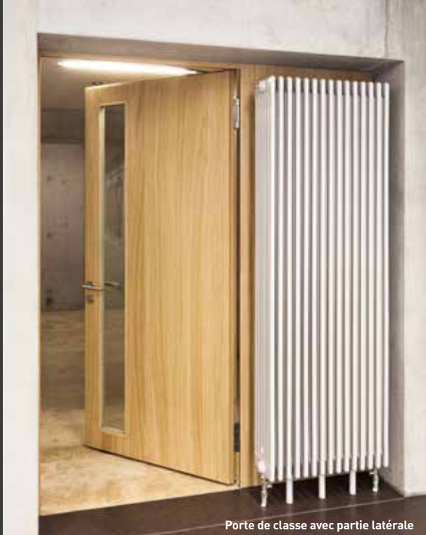
Porte de classe avec partie latérale

Avec la « professionnalisation » des cambriolages, les portes RC ne cessent de gagner en importance. Les propriétaires de maisons et d'appartements veulent protéger efficacement des cambrioleurs leur personne et leurs objets de valeur, et sont de plus en plus à choisir des portes d'entrées certifiées anti-effraction (RC2 ou RC3, par exemple). Une plus grande sécurité est également très demandée dans les bâtiments publics: face à des portes fréquemment équipées de systèmes de sortie de secours, les cambrioleurs percent l'ouvrant ou le vitrage avant de faire sauter la fonction anti-panique. La FeuerschutzTeam y a réagi et offre dès à présent des portes RC2 et RC3 perfectionnées à 1 ou 2 vantaux avec certification anti-panique.