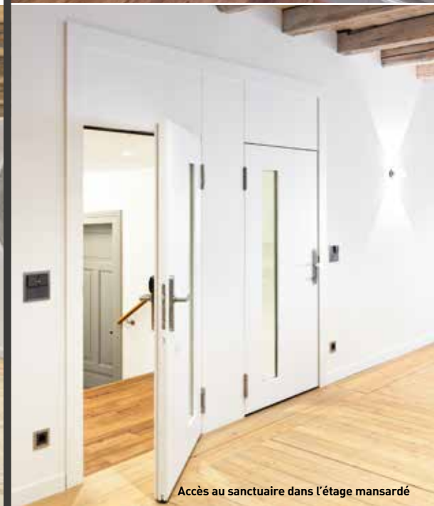
Accès au sanctuaire dans l'étage mansardé