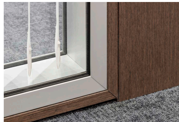
Den Durchblick bewahren und doch schalldicht!

FeuerschutzTeam Mitglied Wider SA Bussigny hat das Nestlé Headquarter in Vevey mit raumhohen Schallschutz-Glasstrennwänden nach EI30 sowie EI30 Drehtüren ausgestattet.