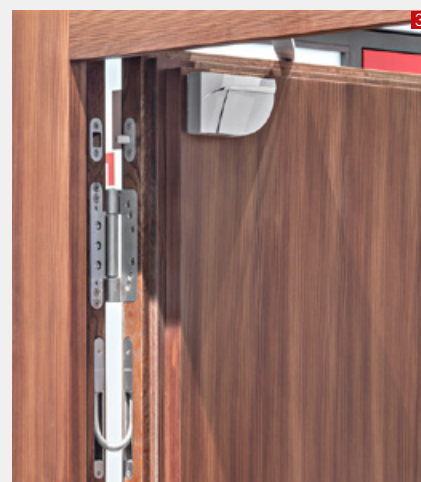
1 Ganzglastüre EI30 in Verglasung eingebaut 2 Schiebetüre EI30 mit Fluchttüre 3 Drehtüre automatisiert EI30, RC4, FB4