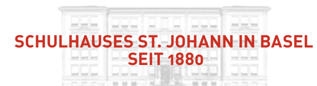
SCHULHAUSES ST. JOHANN IN BASEL SEIT 1880

Um die Atmosphäre und Qualität des Schulhauses St. Johann bestmöglich wiederzubeleben, haben wir uns intensiv mit den original Plänen, Materialien und Farben beschäftigt. In der Umsetzung war die Schreinerei Schneider AG dann ein Partner, der aus Ideen, konstruktiven Anforderungen und Know-how überzeugende Lösungen entwickelt hat.