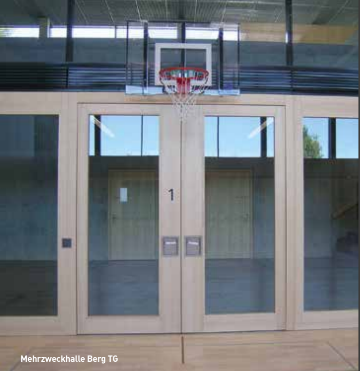
Mehrzweckhalle Berg TG