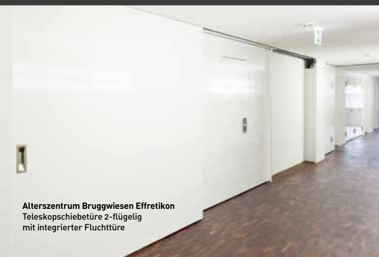
Alterszentrum Bruggwiesen Effretikon Teleskopschiebetüre 2-flügelig mit integrierter Fluchttüre