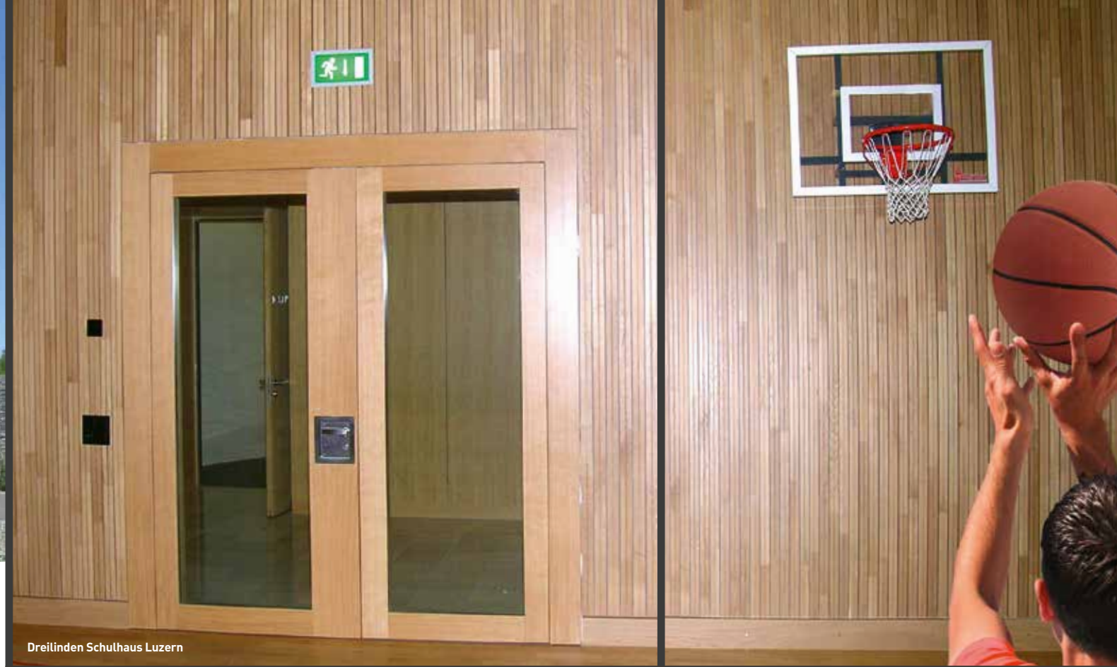
Dreilinden Schulhaus Luzern

A ufgrund ihrer Nutzung unterscheiden sich Sporthallen grundlegend von Bürogebäuden und Wohnhäusern. Intensiver körperlicher Einsatz gehört genauso zum Sport wie die Begeisterung der Aktiven und Zuschauer. Personensicherheit ist daher bei der Planung und Ausstattung von Sportstätten ein wichtiger Punkt, der sich naturgemäss auch auf den Brandschutz in diesen Gebäuden auswirkt: Gemäss Europäischen Normen (EN), die auch die Schweiz übernimmt, sind hier insbesondere Ballwurfsicherheit und Aufprallschutz nachzuweisen.