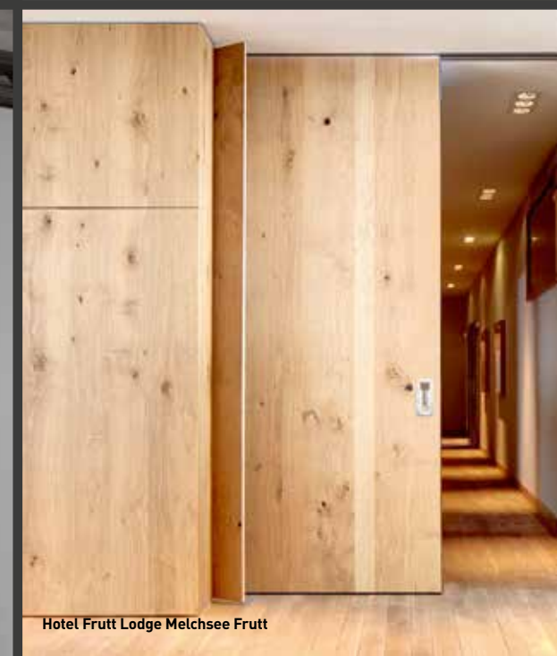
Hotel Frutt Lodge Melchsee Frutt