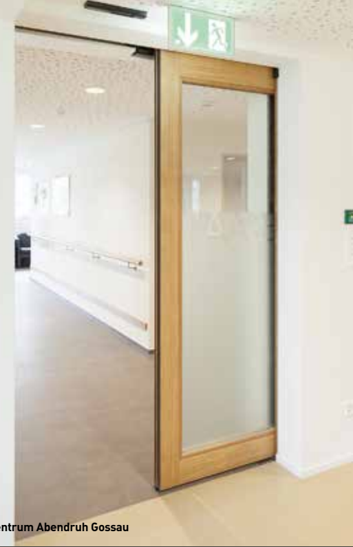
Alterszentrum Abendruh Gossau

Wenn aus baulichen Gründen nur minimaler Raum zur Verfügung steht oder eine Drehtür aufgrund des Geschehens im Schwenkbereich unpraktikabel ist – dann sind Brandschutz-Schiebetüren die ideale Lösung. Sie erhalten so als 1- und 2-flügelige Elemente vollständig die Durchgangslichte und vereinen in ihrer Funktion optimale Sicherheit und einfache, tägliche Nutzung – wie die hier angeführten FeuerschutzTeam Projekte zeigen. Insgesamt verfügt das Feuerschutz-Team über 9 VKF Zulassungen für Schiebetüren, die entsprechenden Nummern finden Sie in der Übersicht auf der Rückseite.