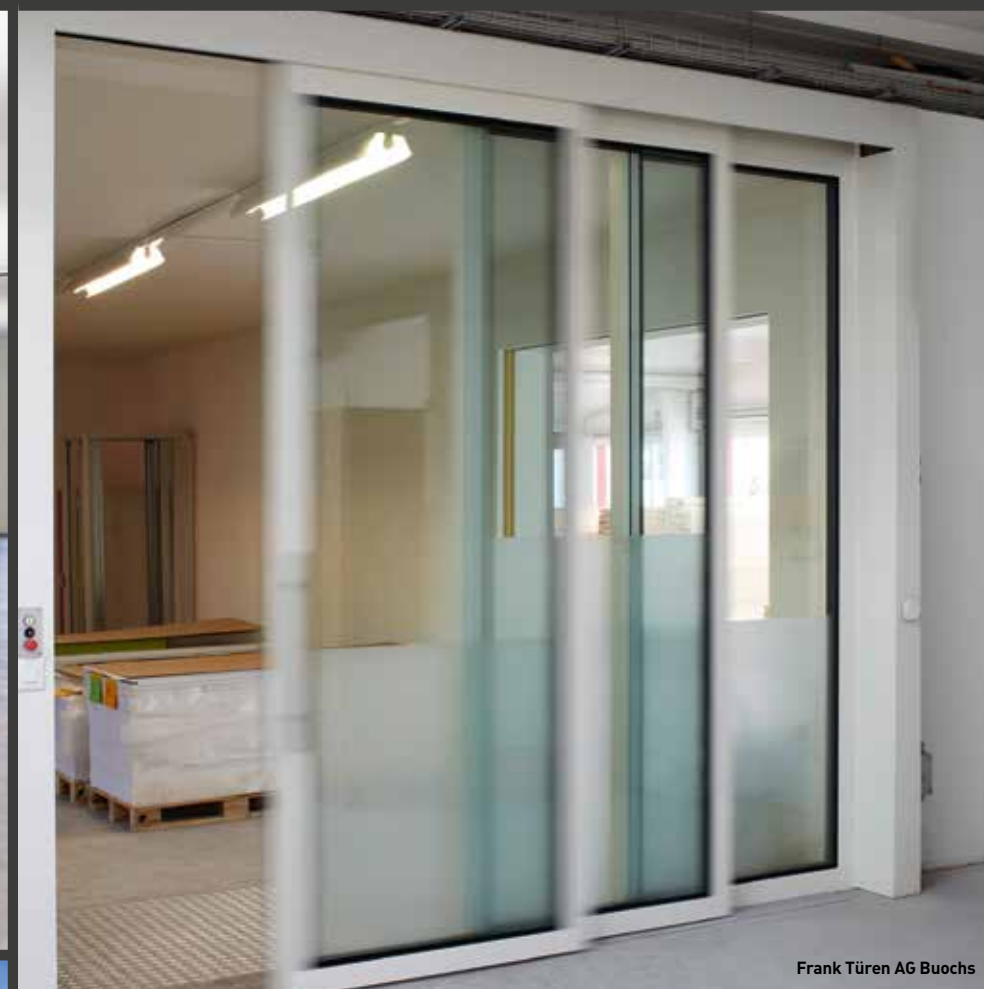
Frank Türen AG Buochs